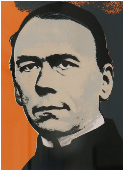
Adolph Kolping (Seelsorger und Sozialreformer, 1813–1865)